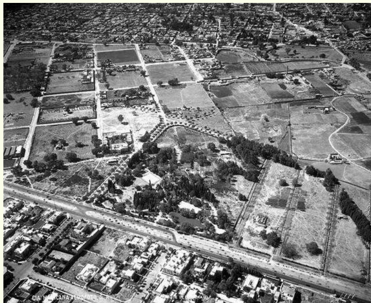
Vista aérea de la colonia Nápoles en los 30

Por lo general, las reuniones se celebraban en el Parque de la Lama en la colonia Nápoles ( ahora World Trade Center).